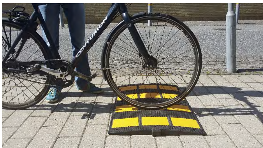
Figur 5. Det præfabrikerede gul/sorte bump.