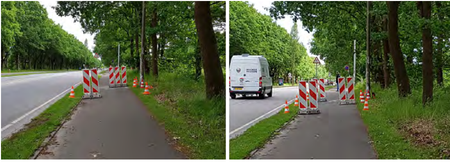
Figur 2. Forsætning af cykelarealet med 1,1m høje N42 tavler i plast. Til venstre ses design 2.1 med indsnævring af cykelarealet først fra venstre og dernæst fra højre med en afstand på 4 m. Til højre ses design 2.2 med indsnævring af cykelarealet først fra venstre, dernæst fra højre og dernæst igen fra venstre med 4 m mellem indsnævringerne.