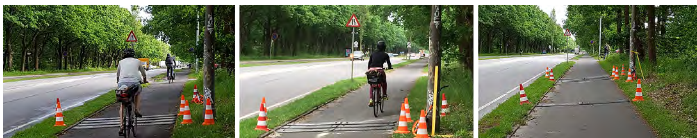
Figur 1. De sorte mobile rumleriller er 2 cm høje og 33 cm bredde. De sættes sammen af moduler, der er 110 cm lange. Til venstre ses design 1.1 med 4 rumleriller med indbyrdes afstand 20 cm. I midten ses design 1.2 med 3 rumleriller med indbyrdes afstand 20 cm. Til højre ses design 1.3 med 4 rumleriller, hvor afstand mellem de to første er 6 m, mens afstand mellem de sidste tre er 20 cm.

De testede fartdæmpere for cykeltrafik inkluderer: tre alternative opstillinger med sorte mobile rumleriller (figur 1), to alternative opstillinger med forsætninger af cykelarealet med brug af lette N42 tavler af plast (figur 2) samt tre alternative opstillinger med præfabrikerede gul/sorte bump (figur 3). Testprogrammet blev gennemført på en 2,2 m bred enkeltrettet cykelsti langs Lundtoftevej i Lyngby-Taarbæk Kommune. Teststrækningen var 80 m lang.