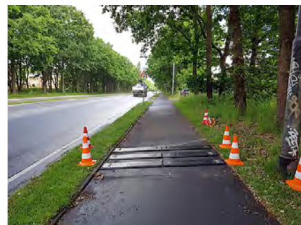
Figur 6. De mobile sorte rumleriller.

testkørslerne hen over de gul/sorte bump blev det konstateret, at komforten steg i takt med et lavere hastighedsniveau. Det betyder, at cyklister, der vælger at nedsætte hastigheden inden passage af bumpene, bliver belønnet med en bedre komfort.