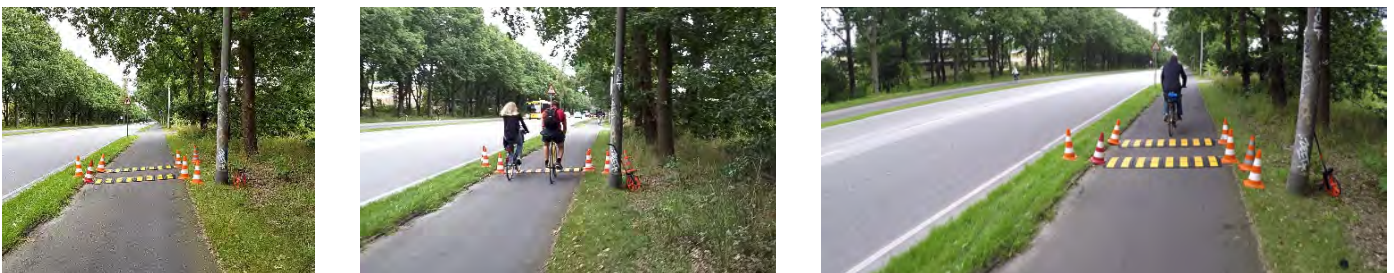
Figur 3. Præfabrikerede bump i gult/sort med højde 3 cm, bredde 48 cm. De sættes sammen af moduler, der er 60 cm lange. Til venstre ses design 3.1 med 2 bump med indbyrdes afstand på 1 m. I midten ses design 3.2 med et enkelt bump. Til højre ses design 3.3 med 2 bump med indbyrdes afstand 0,75 m.