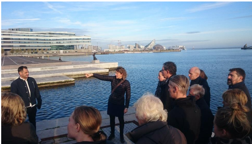
Walk and talk om byudvikling omkring Dokken og introduktionen af letbanen i Aarhus på det seneste netværksmøde.

Ca. hvert andet år organiserer CED endvidere en fælles studietur for medlemmerne, hvor vi samler inspiration fra etablerede og spirende cykelbyer i udlandet. Hidtil har vi besøgt New York og en række byer i Holland, Sydtyskland, Schweiz, Norge og Sverige.